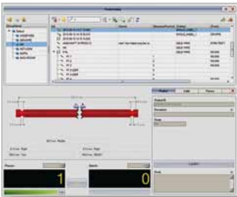
TopWin für Kappa

Mit Hilfe von TopWin Kappa lassen sich Produkte, Kabel und Aufträge für die Kappa Produktionsautomaten komfortabel auf dem PC erstellen und für die anschließende Produktion auf die Maschine laden. Mit der Version 11.1 wurde die Software in enger Zusammenarbeit mit Kunden optimiert, um eine noch höhere Bedienerfreundlichkeit zu erlangen. Auch der Funktionsumfang wurde erheblich erweitert.